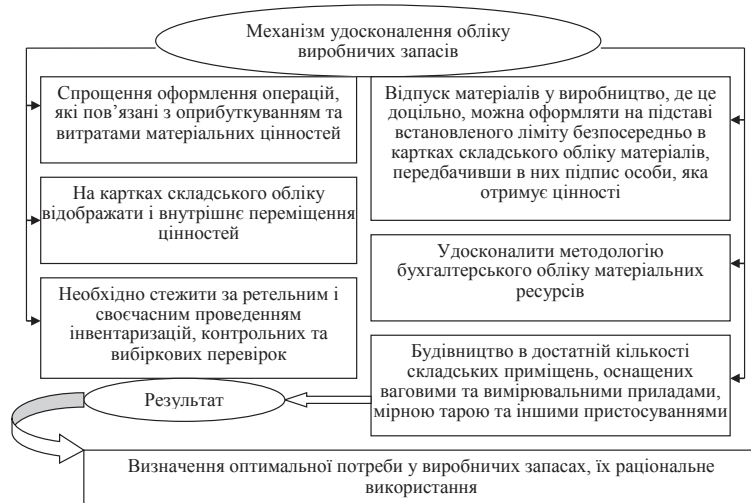
Рис. 2. Економічний механізм удосконалення обліку виробничих запасів

Значно поліпшити організацію обліку виробничих запасів можна, удосконалюючи процес документування, тобто ширше використовуючи накопичувальні документи (лімітно-забірні картки, відомості тощо), картки складського обліку як витратний документ по відпущених матеріалах (бездокументальну систему оформлення витрат матеріалів).