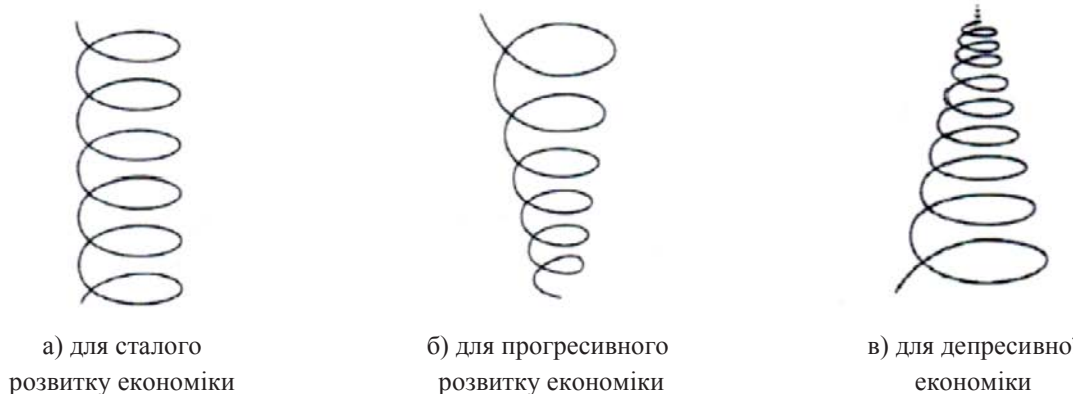
Рис. 2. Різновиди відтворення циклу формування національного добробуту залежно від стану економіки

Висновки. Таким чином, бачимо, що за період досліджень розгляд добробуту в економічній науці здійснив перехід від загального обсягу споживання до його структури, потім – від суто матеріальних благ до неречових та духовних і поступово став включати такі чинники існування людини, як відпочинок, здоров'я, культурний та професійний розвиток, стан навколишнього середовища тощо. У сучасних економічних дослідженнях добробут