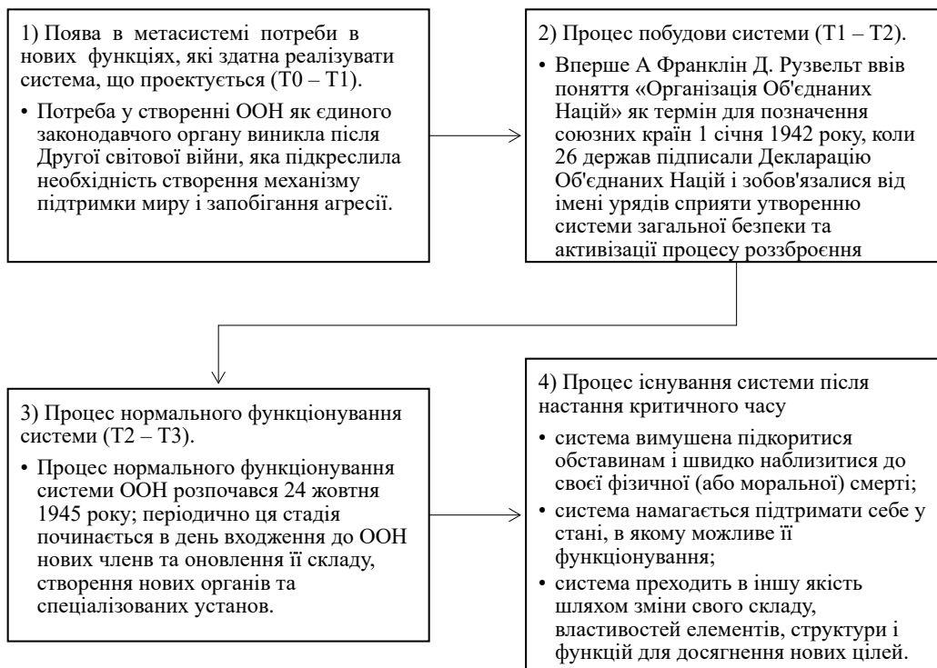
Рис. 1. Життєвий цикл системи ООН