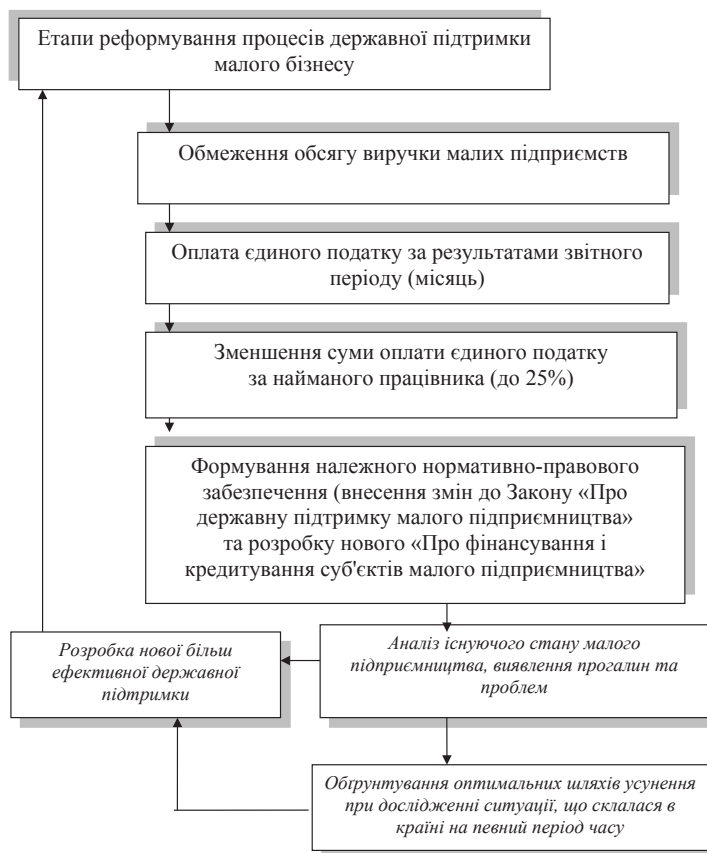
Рис. 2. Етапи реформування державного забезпечення малого бізнесу