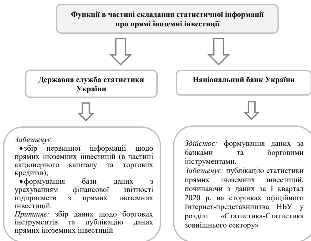
Рис. 3. Функції Державної служби статистики України та Національного банку України в частині складання статистичної інформації про прямі іноземні інвестиції