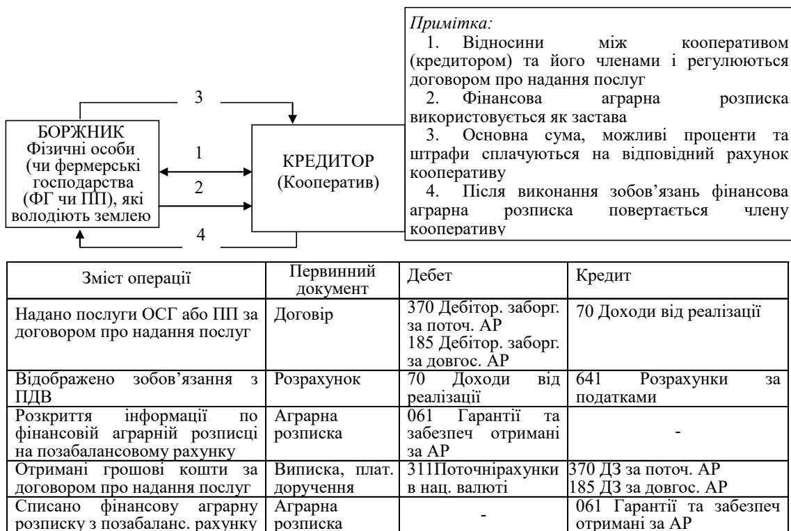
Рис. 2. Загальна модель розрахунків шляхом використання фінансової аграрної розписки для кооперативів