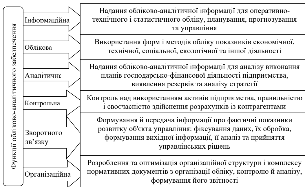
Рис. 1. Функції обліково-аналітичного забезпечення економічної діяльності суб'єкта підприємництва

Висновки. Основною місією обліково-аналітичного забезпечення є неупереджене та своєчасне відображення економічного стану суб'єкта підприємництва шляхом збору та реєстрації первинної інформації, її обробки та формування зведених, аналітичних і синтетичних показників відповідно до облікової політики підприємства. Підвищення економічної ефективності суб'єктів підприємницької діяльності передбачає забезпечення синхро-