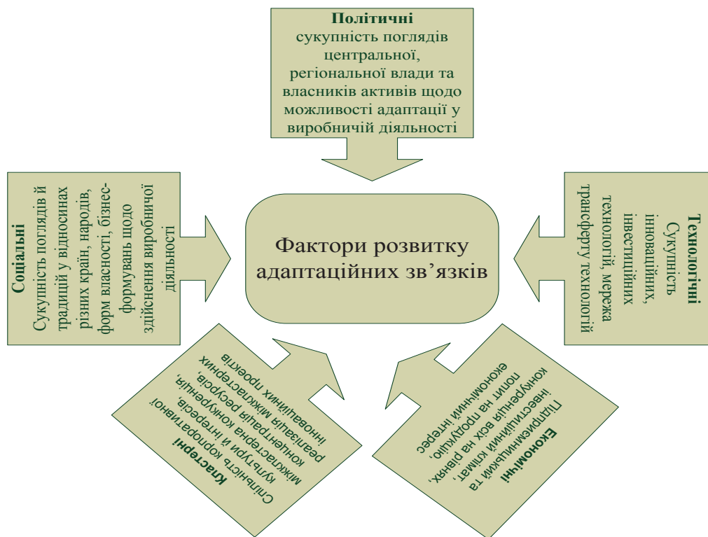
Рис. 2. Фактори розвитку адаптаційних зв'язків кластеру за умов конкурентного середовища