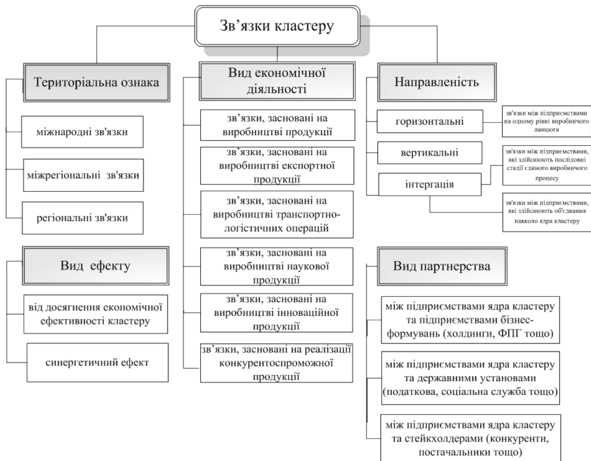
Рис. 1. Система класифікації адаптаційних зв'язків кластера