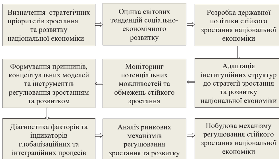
Рис. 1. Етапи побудови механізму регулювання стійкого зростання національної економіки в умовах глобалізації

Представлені принципи та концептуальні моделі застосовуються при формуванні механізму макроекономічного регулювання стійкого зростання національної економіки, який характеризується позитивною динамікою