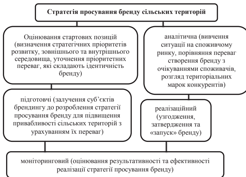
Рис. 4. Стратегія просування бренду сільських територій

Родзинкою Вінницького регіону є оздоровчі санаторії в таких містах, як Хмільник, Немирів, Вінниця, адже