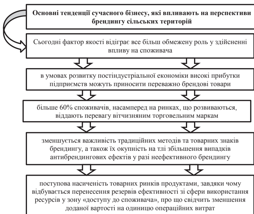
Рис. 2. Основні тенденції сучасного бізнесу, які впливають на перспективи брендингу сільських територій

Актуальність та перспективи брендингу загалом та брендингу територій зокрема можна уточнити через такі основні тенденції (іноді суперечливі) сучасного бізнесу, які відзначаються в роботах багатьох вчених (рис. 2).