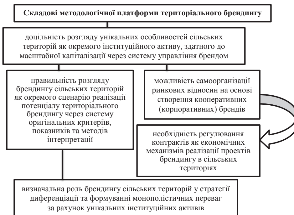
Рис. 5. Складові методологічної платформи територіального брендингу