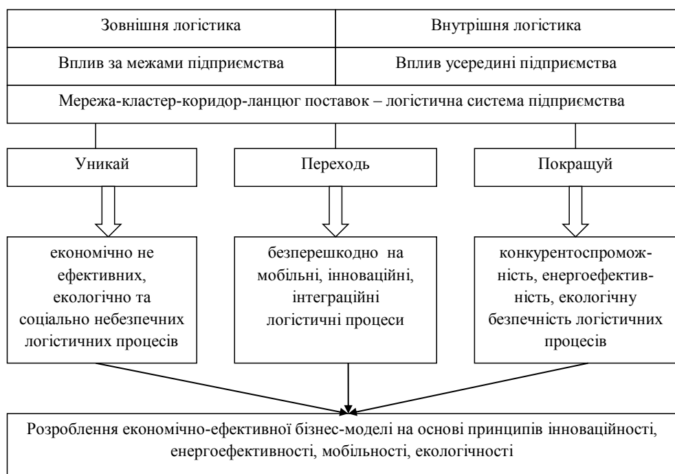
Рис. 1. Суть концепції «уникай, переходь, покращуй» ринку логістичних послуг

Тому основними завданнями гравців ринку логістичних послуг має бути модернізація економіки та підвищення конкурентоспроможності через поліпшення якості логістичних послуг у контексті екологічності та інноваційності; підвищення конкурентоспроможності логістичних послуг з метою визнання українського бізнесу на світовій арені як соціально відповідального, його полегшеної інтеграції в міжнародні ринки; застосування інструментів ресурсозбереження та енергоефективності, «озеленення» бізнесу та економіки країни у цілому.