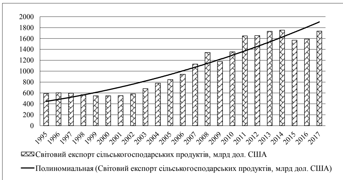
Рис. 2. Динаміка світового експорту сільськогосподарською продукцією 1995-2017 рр., млрд дол. США

Єгипет, Нідерланди й Туреччина є лідерами серед країн-імпортерів української сільськогосподарської продукції (табл. 2). Як свідчать дані табл. 2, до країн, які активно нарощували обсяги торгівлі сільськогосподарською продукцією з Україною, слід віднести Нідерланди, в яких темп приросту за 2013–2017 рр. становить 4,3 в. п., Туреччину – 1,9 в. п., Китай – 1,4 в. п., Єгипет – 1,3 в. п. Найбільше знизили частку імпорту української сільськогосподарської продукції такі країни, як Росія, а саме на 10,83 в. п., Індія – на 3,25 в. п., Польща – на 1,64 в. п.