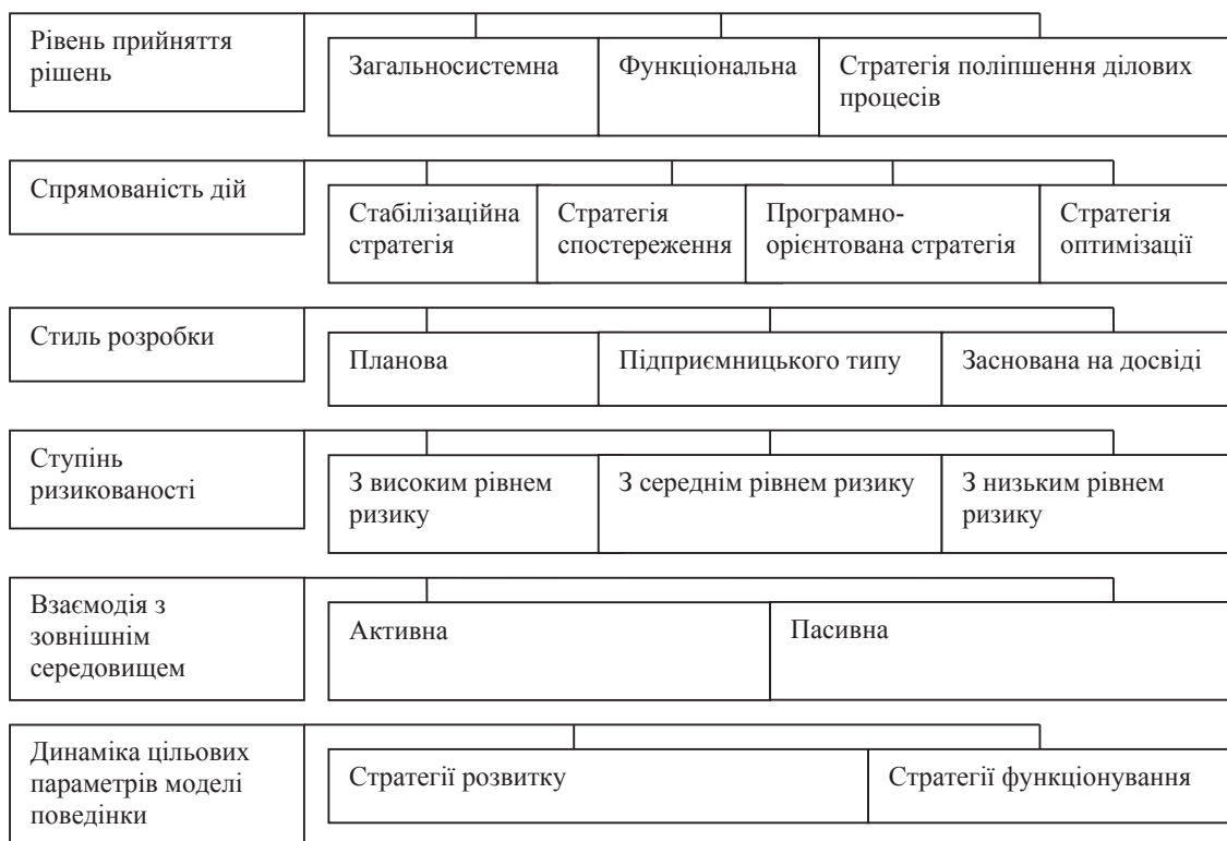
Рис. 1. Класифікація стратегій соціально-економічних систем